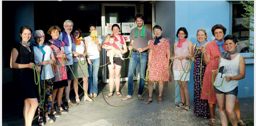
Une partie du conseil des accordeurs.

L'organisation 'classique' pyramidale avec 1 présidente et quelques membres du bureau, a été remplacée par 18 co-présidents responsables de 9 commissions. La mise en pratique s'est faite avec un expert, car « c'est tout sauf l'anarchie » ! Un mode de fonctionnement qui colle parfaitement aux valeurs de l'Accorderie de « faire ensemble ».