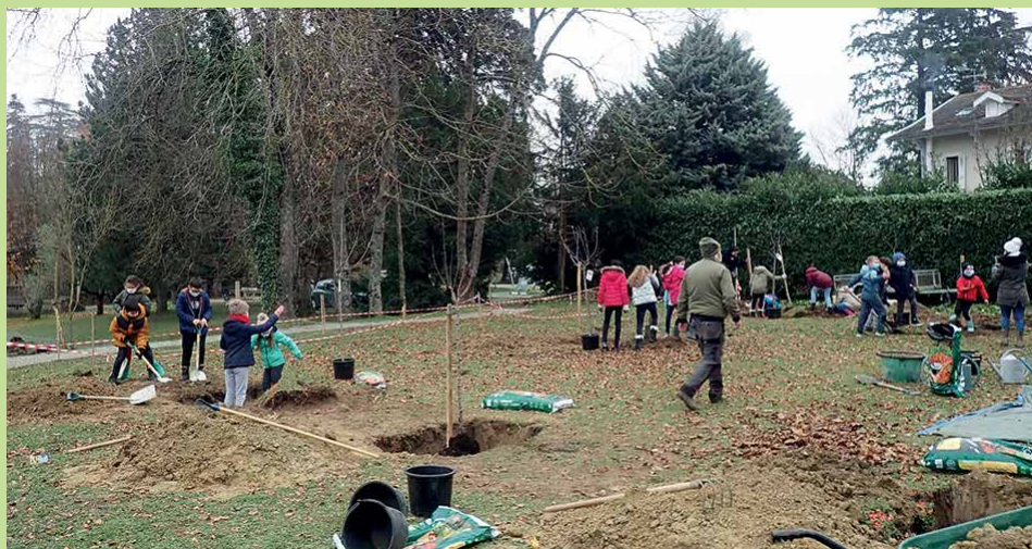
Plantation de verger avec les Cm1/Cm2 de l'école de Viry le 30 novembre 2020 organisée par la MJC de Viry et Apollon74.