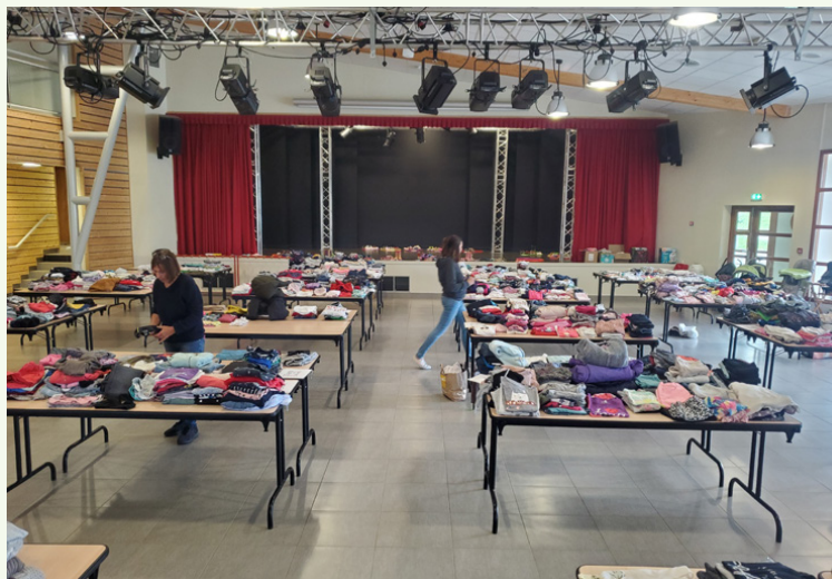
Troc à l'Ellipse : deux fois par an, cet événement solidaire lutte contre la pauvreté et le gaspillage.